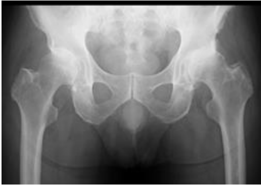
変形性股関節症 術前

人工股関節は、臼蓋側の金属製のカップ・骨頭、大腿骨側のステムからなります。カップの内側には軟骨の代わりとなるプラスチックでできたライナーがはまるようになっています。骨頭がライナーにはまることで、滑らかな股関節の動きが再現できます。痛みの原因となるすり減った軟骨と傷んだ骨が人工物に置き換えられて痛みがなくなることが期待されます。