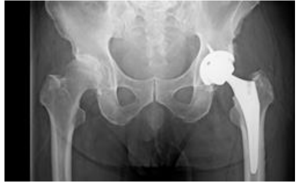
人工股関節置換術 術後

人工膝関節は、すり減った軟骨や傷んだ骨を薄く切除し、金属、セラミック、ポリエチレンでできた人工関節に置き換える手術です。軟骨と骨をとり除く際に、骨・軟骨の切除量、靭帯のバランスなどを調整することによって、O脚の患者さんは下肢をまっすぐに矯正します。痛みの原因をとり除き、人工関節に置き換えることによって、膝の痛みをなくすことが期待されます。