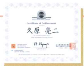
日本静脈経腸栄養学会研修終了