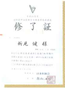
医療安全推進者養成講座終了