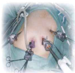
当院での術中風景

例えば胃の開腹手術では傷の長さが約15cm余りになります。腹腔鏡下胃切除では12mmの傷3個、5mmの傷2個、40mmの傷が1個できますので全長8.6cmになり約半分です。しかし、果たしてそれだけが腹腔鏡下手術の優れたところでしょうか。開腹手術では大きく切り開かれた傷から胃や腸の内臓が空気にさらされ酸化障害も起こるでしょうし、強い光を浴びて乾燥します。一方、腹腔鏡下手術では湿度100%の密室の中で大きな力を加えず手術するため障害が少ないと思われまます。