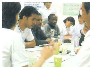
ディスカッション風景