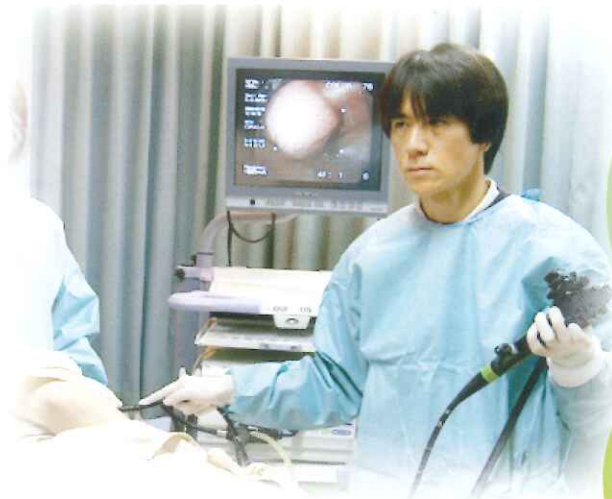
消化器内科部長 / 内視鏡センター長