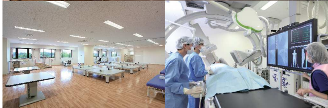
リハビリテーションセンター