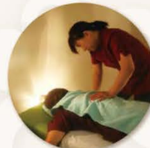
職員専用マッサージルーム