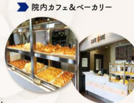
院内カフェ&ベーカリー